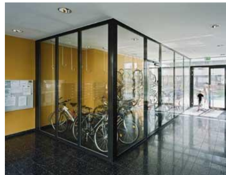
Il nuovo quartiere "Bike city" a Vienna fa onore al suo nome.