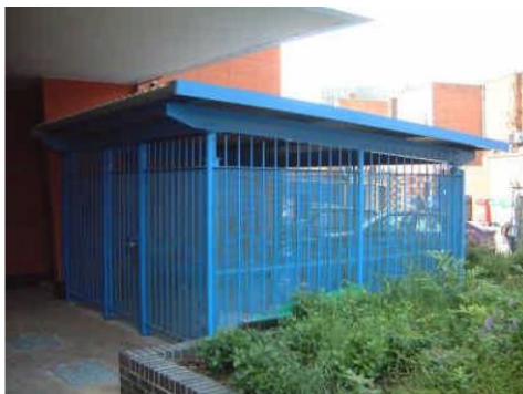
Depositi esterni per biciclette sicuri e ben visibili per appartamenti Porsmouth, UK

Le città stanno sperimentando sempre più le potenzialità dei nuovi quartieri sostenibili, spesso concepiti come aree a traffico limitato . Il principio di base prevede di riservare almeno una parte delle abitazioni a persone che non dispongono di un'auto, ma che, in cambio, hanno accesso a un'ampia scelta di mezzi di trasporto alternativi, inclusi trasporti pubblici, auto condivise (car sharing) e naturalmente biciclette.