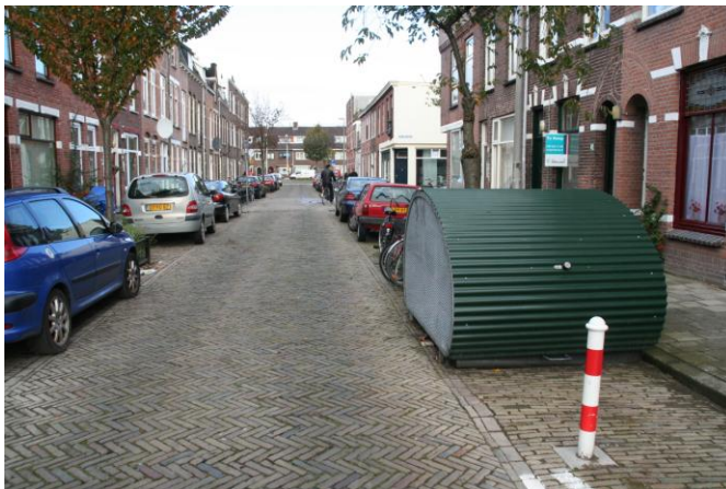
Una cupola per biciclette sulla corsia di parcheggio di una strada residenziale, con un dissuasore che ne protegge l'accesso. Utrecht, NL 2