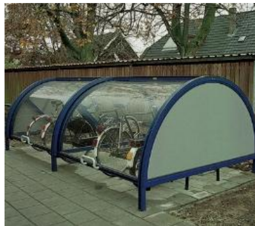
Cupola per biciclette con un design trasparente e più leggero. 3